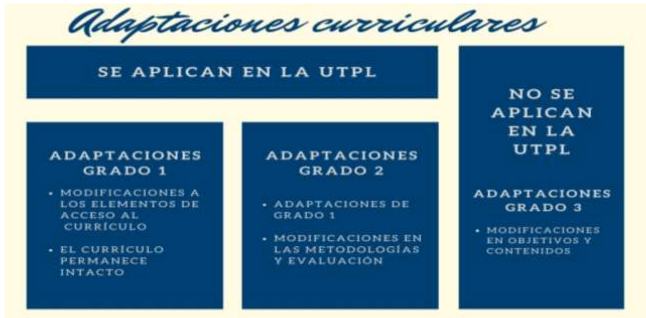
Gráfico 2. Grados de Adaptación Curricular.